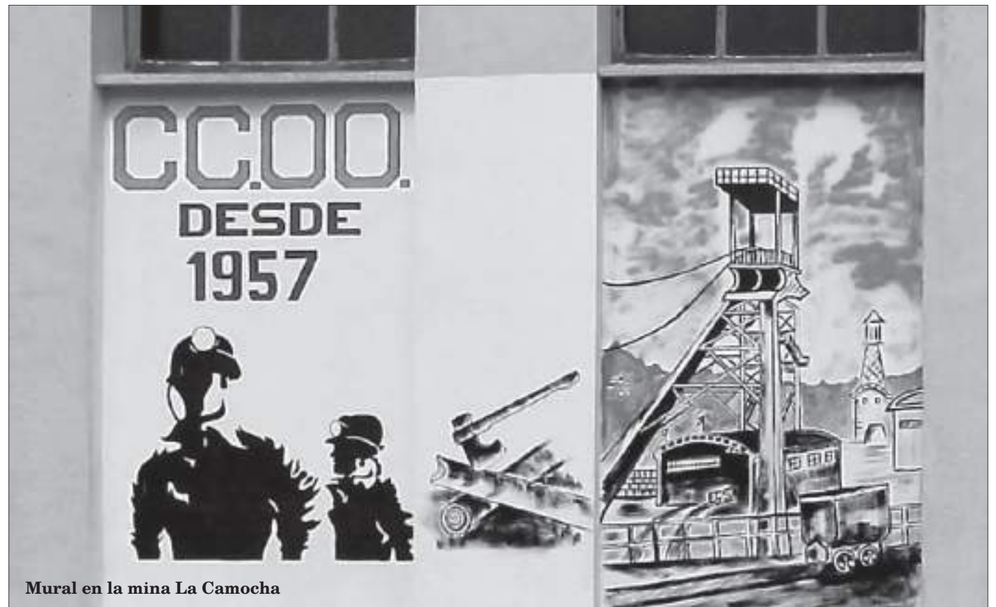
Mural en la mina La Camocha

Sin embargo, la Comisión de La Camocha coge relevancia como mito fundacional por diversos motivos,